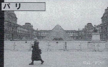
パリ ルーブル美術館は閉鎖され、許可証なしの外出には罰金が科される