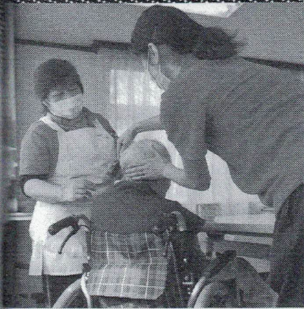
高齢者たちの自宅ひきこもりによって認知症や死亡リスクが高まるという

《仮に首都東京のロックダウンが1か月実施される場合、東京都の消費が55・5%減少するとすれば、それは日本全体の個人消費を2・49兆円減少させる。(中略) 1か月のロックダウンであっても、