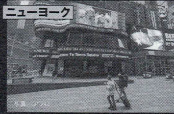
ニューヨーク ブロードウエーや映画館を閉鎖し、スーパーでは入場制限を実施中だ