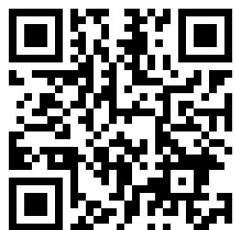
戸村智憲 プロフィール詳細 QRコード

TV・ラジオ生放送でのコメンテーターや、メディアを指導する側にも立つマルチな活動