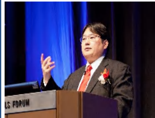
↑外資系の大手IT企業での基調講演シーン