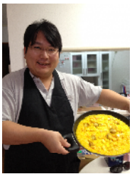
↑得意料理のパエリアを料理中

で活躍中。 人工知能・IoT・ビッグデータやドローンのビジネス活用など先端研究家