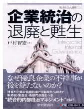
『企業統治の退廃と甦生』(中央経済社)

「難解」を「軟解」に！ソフトなプロ指導者 一見して難しいことはやわらかく、今、そして、これから重要となる経営課題を克服するためのポイント一見して見過ごしそうな問題は深く掘り下げて、 口先だけでなく実体験や総合的な視点から明るく楽しく親しめる指導や講演・研修・執筆