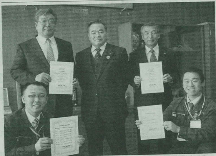
JGAP団体認証を受けた生産者代表やJAの関係者(南幌町で)

し、よりよい農産物を消費者に届ける努力を続けたい」とし、認証の取得だ。者数を増やし生産ロツトを確保していく考え