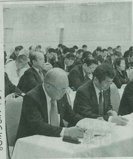
コンプライアンスやTPPについて学ぶ参加者ら(旭川市で)

し、よりよい農産物を消費者に届ける努力を続けたい」とし、認証の取得だ。者数を増やし生産ロツトを確保していく考え