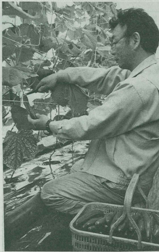
月末まで出荷を見込んでいる。

種。3 等級 5 規格に選別、箱詰めにし (1 箱 5 キ詰め) 1 日約 13 軒を J A 新はこだで森支店濁川事業所に持ち込み、地元函館を中心に札幌など道内市場に「函館育ち/きゅーり」のブランドで 6